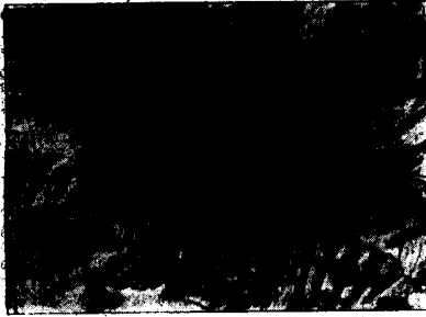
FR. Junf-Vorbericht der Waffen-ff beim Einfluß