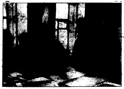
Bei einer nächtlichen Erkundung wurden diese beiden jüdischen Jungen von 17 und 19 Jahren gefangen genommen. Beide sind erst seit dem 6. Februar 1942 eingeschlagen. Tage nur wurden sie mit der Waffe aus-schützt und dann an die Front geschickt.