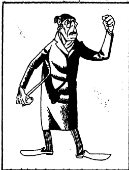
We glimlachen, als opa van schuin tegenover piept, dat hij den slager (die met een hand spelenderwijs een os vellen kan) eens, flink al afdraget.