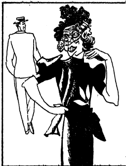
We meesmulen als de setwat overjarige vrouw van de derde verdieping, vol goeden moed op verovering uitgaat.