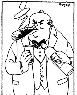
Maar als Churchill verklaart, dat hij popakt om met Amerikaansche hulp Duitschland te kraken en Europa te veroveren, dan vinden we dat heusche soo gek nog niet.