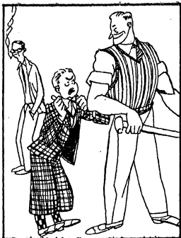
We schateren, als Jantje van de bureu met de stoere kracht van zijn broer, den student, dreigt.