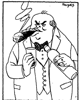
Maar als Churchill verklaart, dat hij popakt om met Amerikaansche hulp Duitschland te kraken en Europa te veroveren, dan vinden we dat heusche soo gek nog niet.