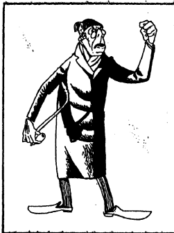
We glimlachen, als opa van schuin tegenover piept, dat hij den slager (die met één hand spelenderwijs een os vellen kan) eens flink al afdraget.